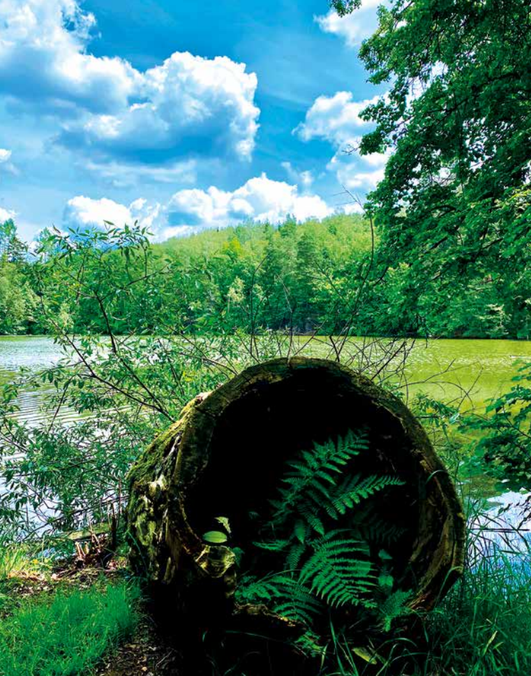
Břeh Mlýnského (Pilského) rybníka

Kamenice. Druhým důvodem bylo využití mokřadů, které se nacházely v okolí těchto budoucích rybníků.