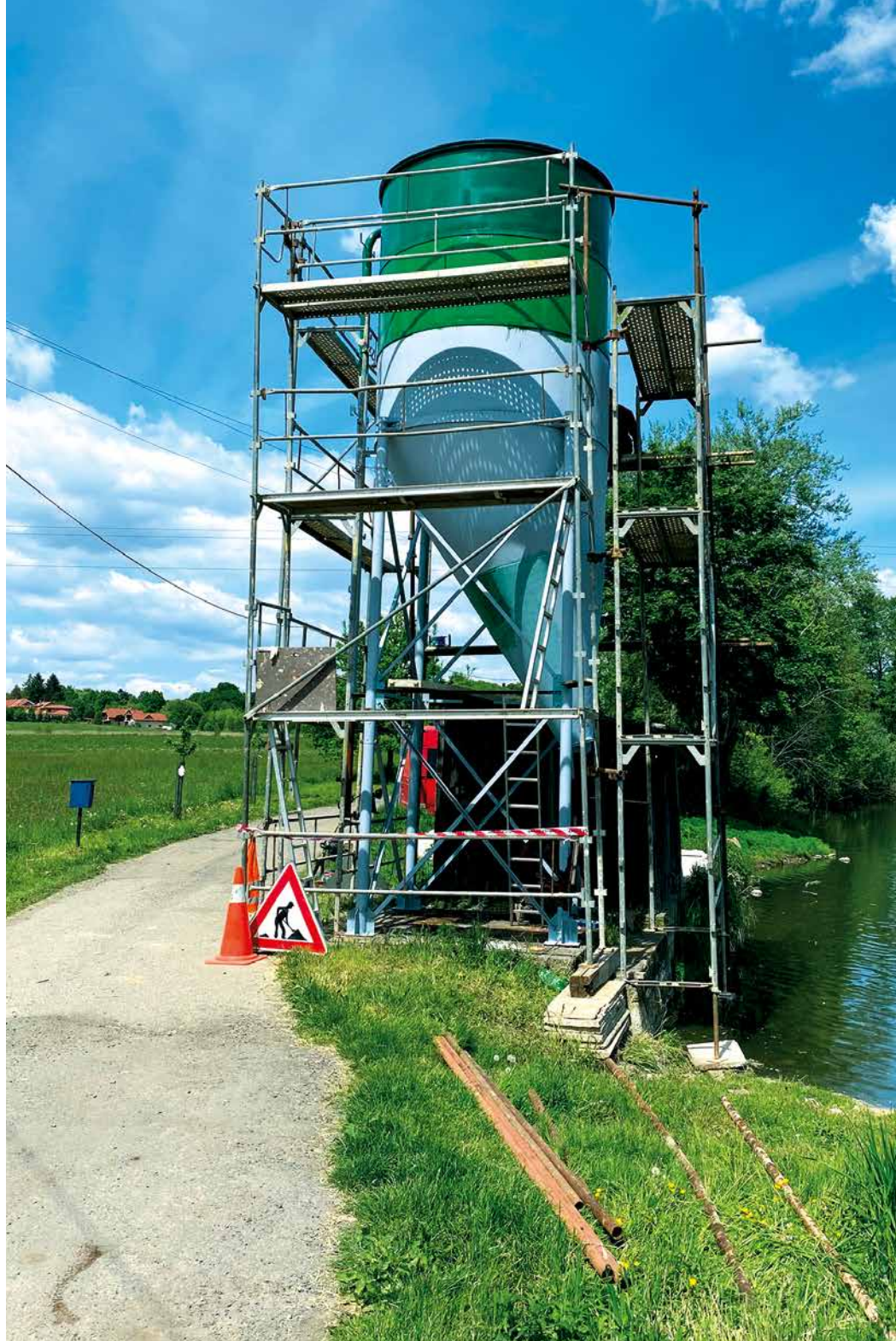
Oprava sila u Štířinského rybníka, květen 2020

Rozhodně nepodporujeme vypouštění jímek do vodních toků! Problémem je ale zvýšení hustoty obyvatel. Stačí se podívat, jak Kamenice a okolí vypadala před 20-30 lety a jak dnes. Pokud by však ČOV nebyly, situace by byla ještě horší. Kapacita rybníků a jejich čistící schopnost je prostě omezená a v důsledku sucha ještě snižena. Voda z ČOV je sice z velké části vyčištěná, ale obsahuje již biologicky mineralizované látky, jež některé vodní organismy, zejména zooplankton (který plní čistící funkci ve vodě) nejsou schopny zcela zpracovat. Naproti tomu tyto látky jsou zdrojem „potravy“ pro fytoplankton. Ten se rychle rozmnožuje, čímž se narušuje biologická rovnováha mezi zooplanktonem a fytoplanktonem. Proto dochází často i k tzv. kvetení vody, ubývá kyslíku ve vodě. A tak se zdá, že voda je kalnější, než bývala. Stačí se podívat, co vytéká z ČOV. Kvůli ČOV se snížil přirozený obsah potravy pro ryby, tudíž my musíme více přikrmovat. Struhařovský rybník býval ještě v 80. letech oblíbeným koupalištěm. Myslíte si, že některé rybníky by se